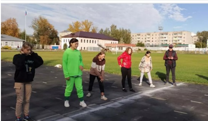
21 сентября состоялся общешкольный кросс "Золотая Осень".

В кроссе участвовали обучающиеся 3-9 классов. Победители и призеры получили почетные грамоты.